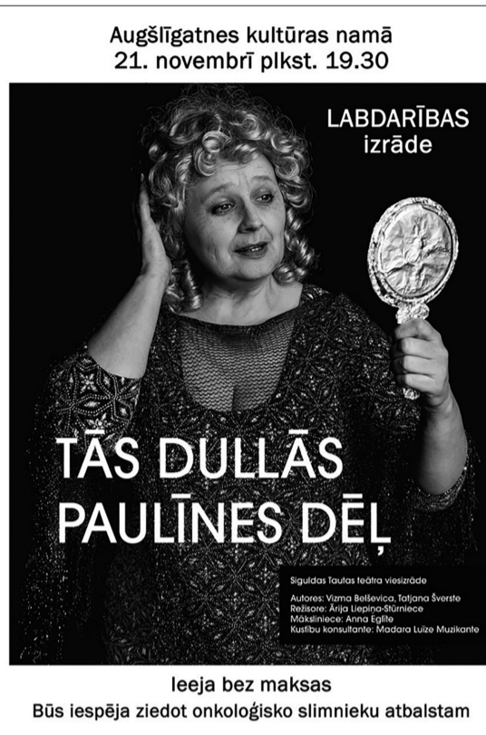
Ieeja bez maksas Būs iespēja ziedot onkoloģisko slimnieku atbalstam