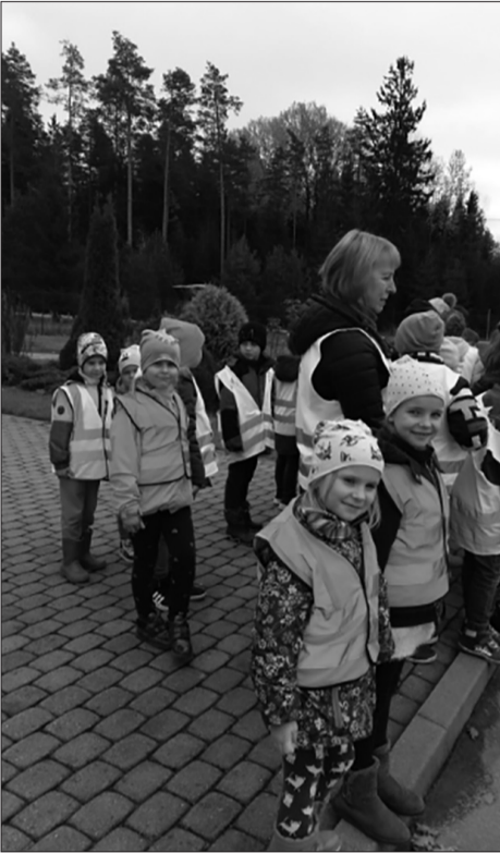
"Līgatnes novada vidusskolas skolēni viesojas "Urdā"

15. oktobrī ESF projekta 8.3.2.2./16/I/001 "Atbalsts izglītojamo individuālo kompetenču attīstībai" ietvaros 1.-3. klašu skolēniem notika mācību vizīte uz ZAAO Dabas un tehnoloģiju parku "Urda". Mācību vizītes laikā notika praktiskā un pētnieciskā nodarbība "Zeme", kuras laikā skolēni devās izglītojošā ekskursijā pa reģionālā atkritumu apsaimniekošanas centra teritoriju, lai izziņātu un izprastu, kāda saistība vides tīrībai ar atkritumu apsaimniekošanu, un darbojās praktiskā nodarbībā laboratorijās, lai papildinātu zināšanas par Zemes resursu aizsargāšanu. Nodarbības beigās bērni varēja piedalīties dažādās spēlēs un rotaļās dabas takās.